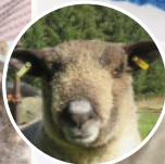
バターナットちゃん (Butternut) ウォルナットちゃんの孫。三つ子で生まれ、お母さんの負担を減らすために、哺乳瓶で育てられたためか、とても人懐っこくスウィートな性格の持ち主です。