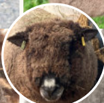
ウィンダミア母さん (Windmere) 多くのショーで成功を収めた名羊。母であることを愛しています。少し恥ずかしがり屋な性格は、娘羊に引き継がれ、息子羊は、自信を持つ子でした。