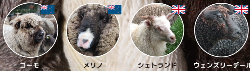
ゴットランドづくし