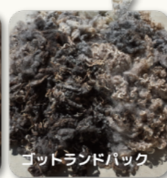
ゴットランドパック