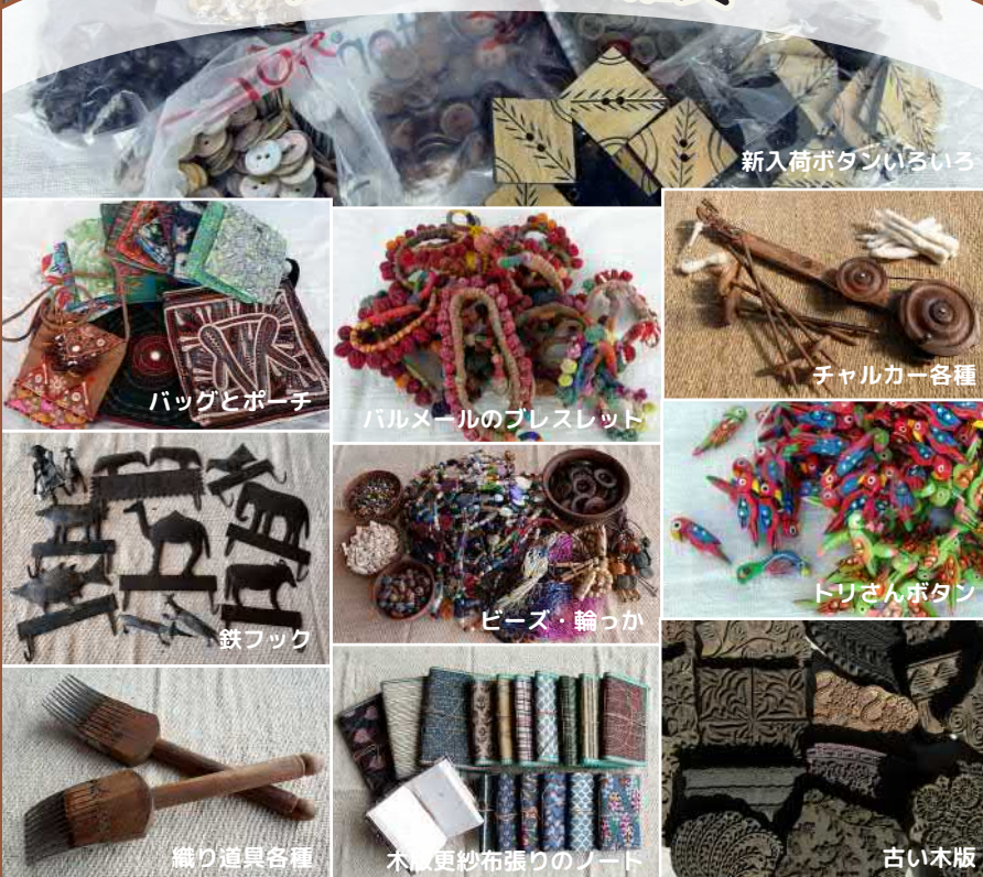
新入荷ボタンいろいろ