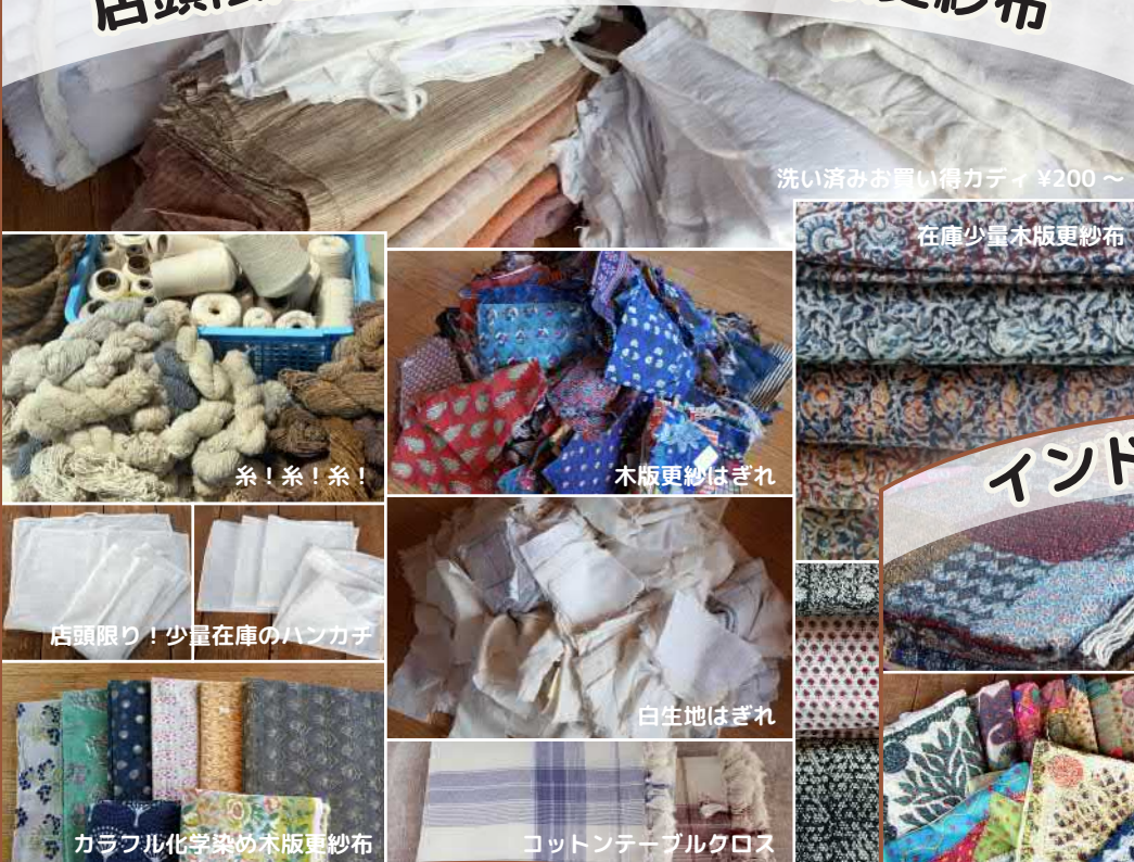
洗い済みお買い得カディ ¥200～