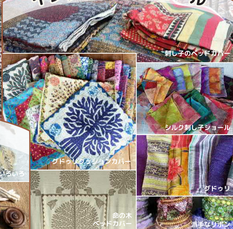
刺し子のベッドカバー