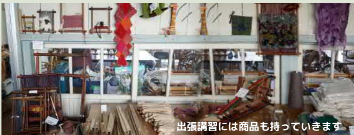
出張講習には商品も持っていきます