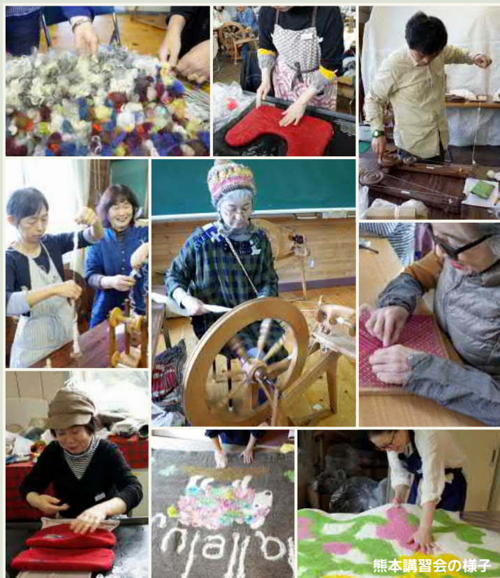
熊本講習会の様子